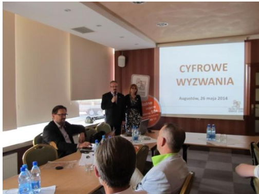
Konferencja „Cyfrowe wyzwania”