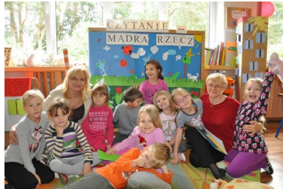
Tydzień Czytania Dzieciom