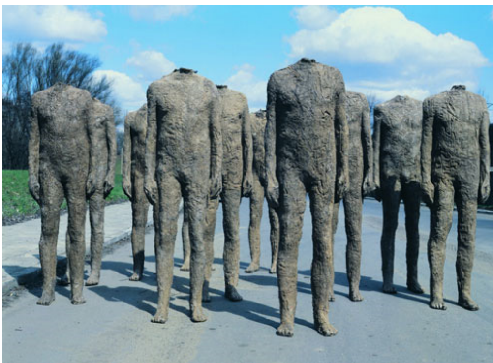
Magdalena Abakanowicz, Tłum , 1988.

Jakie refleksje o współczesnej cywilizacji można odczytać z różnych tekstów kultury? Odpowiedz na podstawie interpretacji dzieła Magdaleny Abakanowicz „Tłum” oraz wybranych przez siebie tekstów literackich.