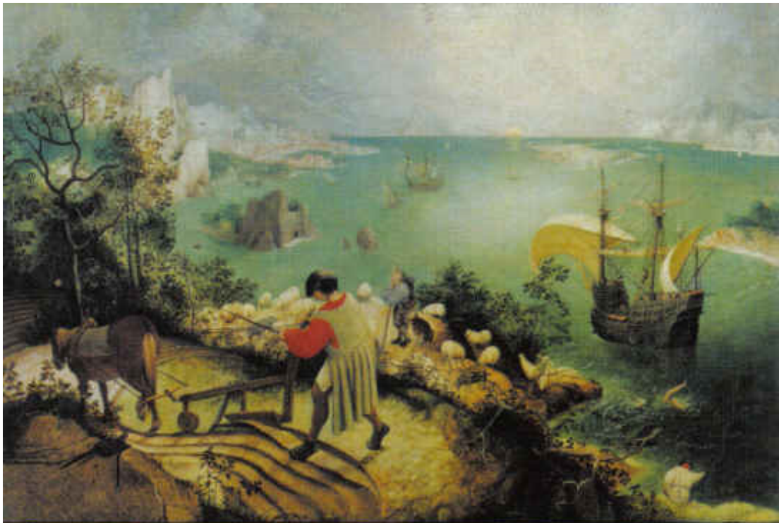
Pieter Bruegel (starszy), Pejzaż z upadkiem Ikara , ok. 1558, Królewskie Muzeum Sztuk Pięknych w Brukseli.

W jaki sposób twórcy późniejszych epok nawiązują do starożytnych mitów? Odpowiedz na podstawie interpretacji obrazu Pietera Bruegla Pejzaż z upadkiem Ikara i wybranego tekstu literackiego.