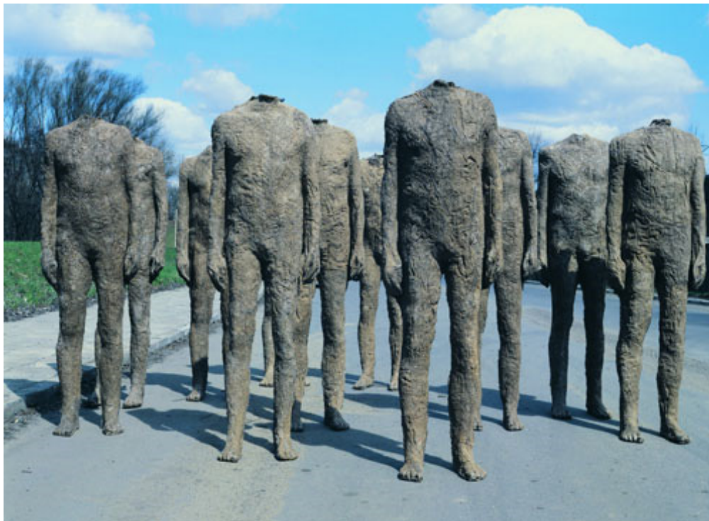
Magdalena Abakanowicz, Tłum , 1988.

Jakie refleksje o współczesnej cywilizacji wyrażają twórcy w swoich dziełach? Odpowiedz na podstawie interpretacji podanego tekstu kultury oraz wybranych tekstów literackich.