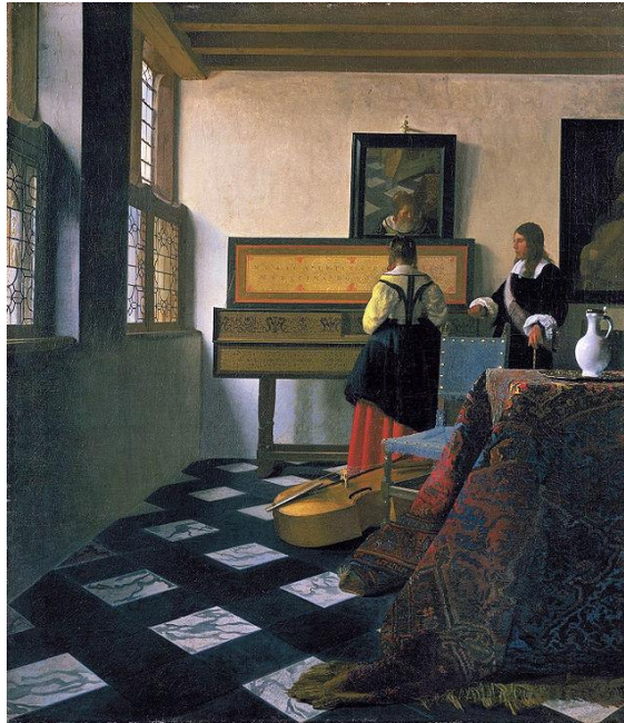
Jan Vermeer, Lekcja muzyki , ok.1659–64, Buckingham Palace.

Jaką rolę w życiu człowieka odgrywa muzyka? Omów zagadnienie, odwołując się do obrazu Jana Vermeera Lekcja muzyki oraz wybranych tekstów kultury.