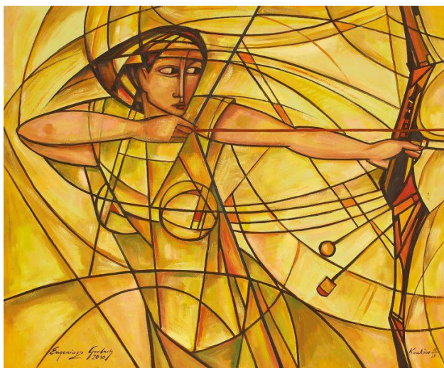
Eugeniusz Gerlach, Luczniczka złota , 2010, Warszawa, Muzeum Sportu i Turystyki.

Czy sport może być interesującym tematem tekstu kultury? Rozważ problem na podstawie obrazu Eugeniusza Gerlacha i wybranych tekstów kultury.