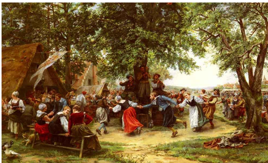
Jean Charles Meissonier (1848–1917), The Village Festival , kolekcja prywatna.

Jakie wizje wsi można odnaleźć w przekazach kulturowych? Omów zagadnienie, odwołując się do obrazu Jeana Charles'a Meissoniera oraz innych tekstów kultury.